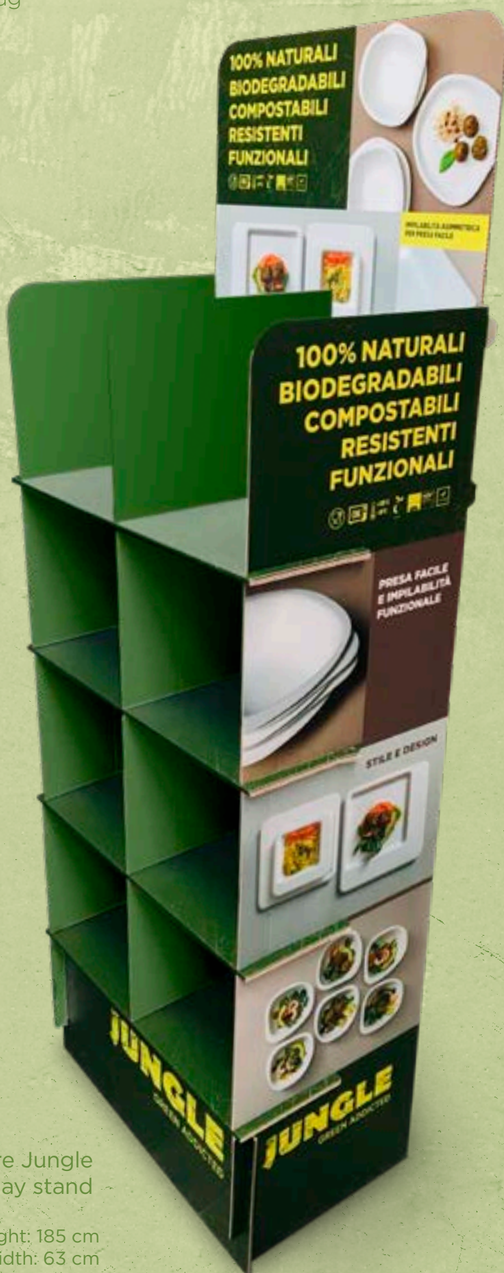
Espositore Jungle Jungle display stand

Altezza/height: 185 cm Larghezza/width: 63 cm Profondità/depth: 40 cm