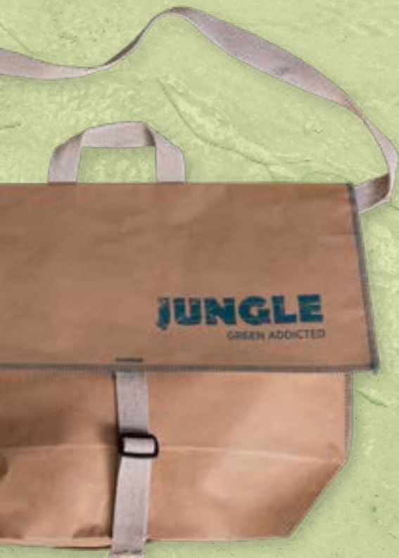
Borsa porta campionario Samples bag